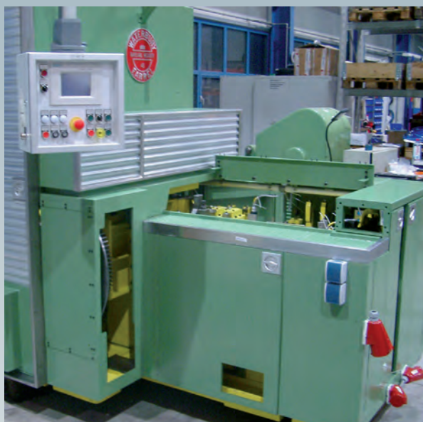
Nach der Generalüberholung