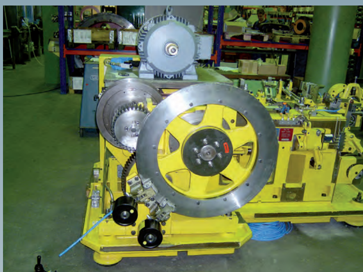
Nach der Generalüberholung

Neben der mechanischen Generalüberholung wurde die Presse mit einem neuen Schmersystem und einer neuen Elektrik ausgestattet.