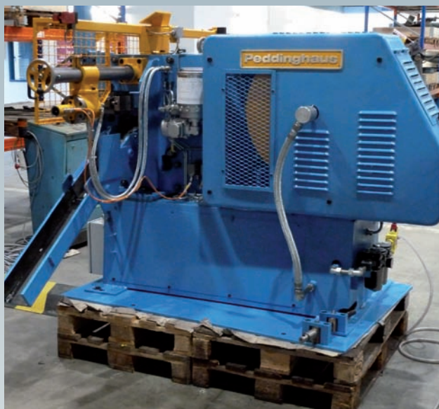
Nach der Generalüberholung

Für Befestigungsmittel oder Kalt- und Warmumformpressen? Gut, dass Sie uns gefunden haben!