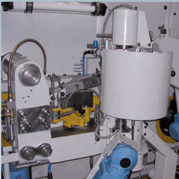
Nach der Generalüberholung