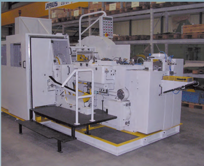
Nach der Generalüberholung

Neben der Generalüberholung wurde die Maschine mit einer hydropneumatischen Spindelklemmung ausgestattet.