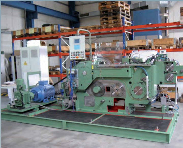
Nach der Generalüberholung

Neben der Generalüberholung wurde die Maschine mit einem kurvengesteuerten Transfer neuester Generation ausgestattet.