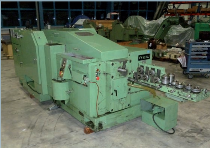
Vor der Generalüberholung

Neben der Generalüberholung wurde die Maschine mit einer neuen Elektrik und einem neuen Schmiersystem ausgestattet.