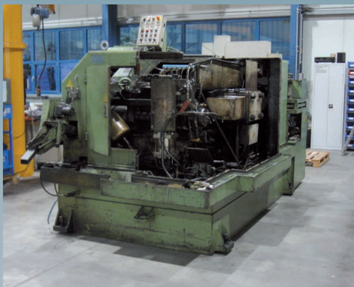
Vor der Generalüberholung

Neben der Generalüberholung wurde die Maschine mit einer neuen Elektrik, Typ Siemens S-7, ausgestattet.