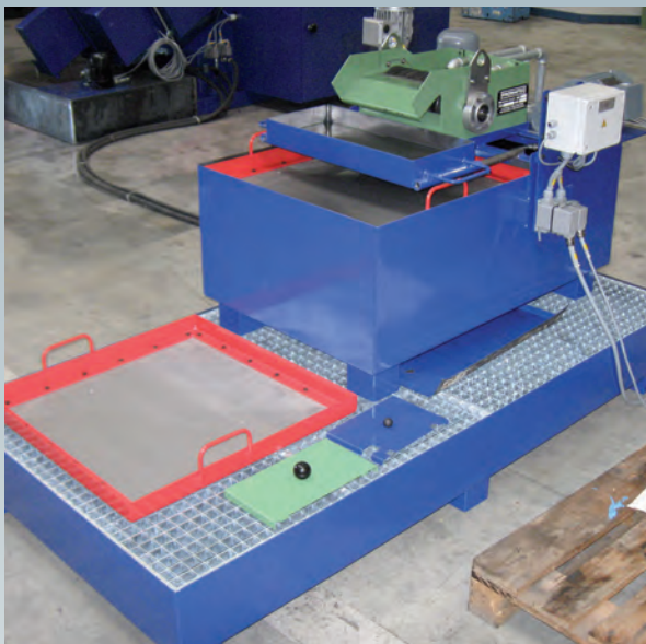
Nach der Generalüberholung