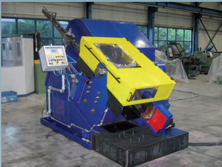
Nach der Generalüberholung

Neben der Generalüberholung wurde die Gewindewalze mit einem pneumatischen Bremssystem, einer neuen Elektrik und einer Ölaufbereitungseinheit ausgestattet.