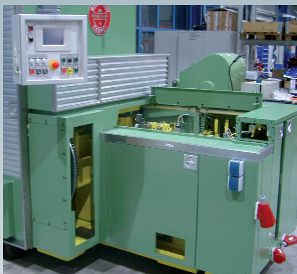
Après la révision générale