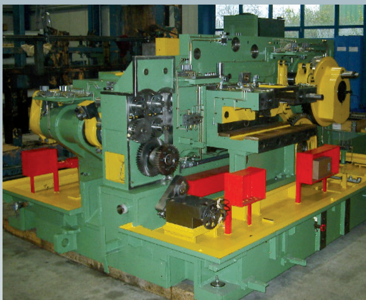
Cours la révision générale

Vous travaillez avec des machines pour matériel de fixation ou des presses pour la forgeage à chaud et à froid ? Vous êtes à la bonne adresse!