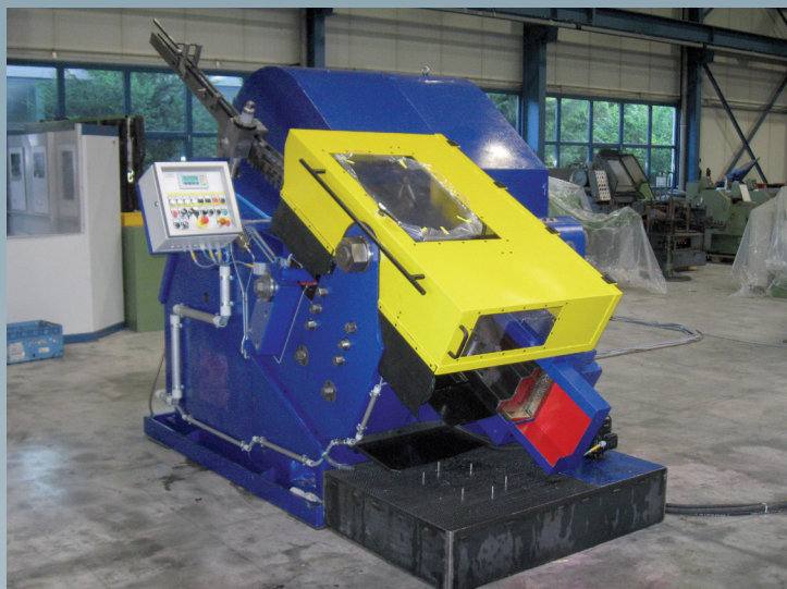
Après la révision générale

Après la révision générale la machine à rouler les filets a été équipée avec un système de frein pneumatique, un nouveau système électrique et un système de reconditionnement d'huile.