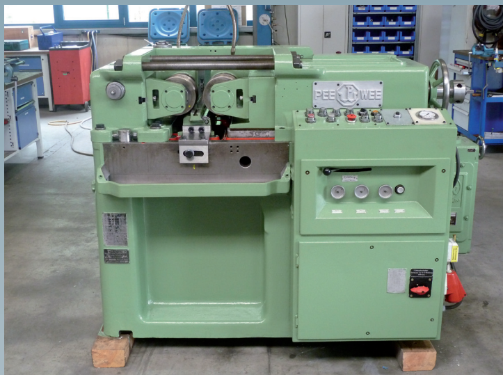
Après la révision générale

La machine à rouler les filets a été révisée généralement en vue de la mécanique. Le système électrique a été contrôlé et le câblage renouvelé. La lubrification a aussi été renouvelée.