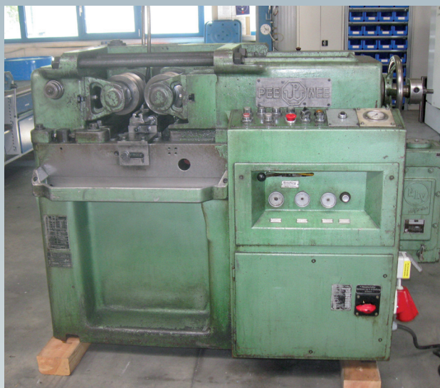
Avant la révision générale

Nous sommes à votre service, partout dans le monde, et ce, 24 h sur 24 !