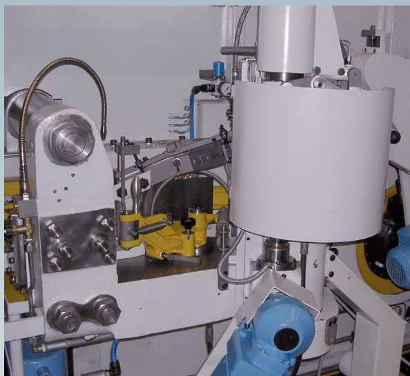
Après la révision générale

Nous sommes à votre service, partout dans le monde, et ce, 24 h sur 24 !