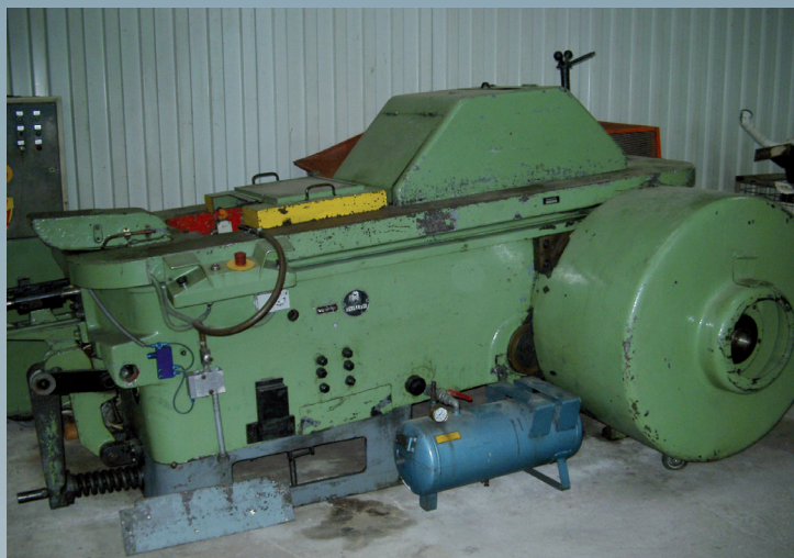
Avant la révision générale

À part de la révision générale, la machine a été équipée d'un nouveau système électrique ainsi que d'une nouvelle lubrification.