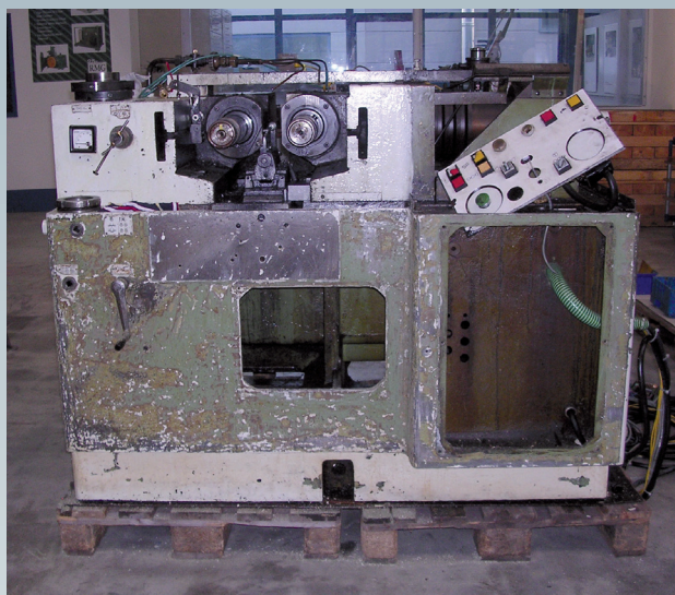
Avant la révision générale

Nous sommes à votre service, partout dans le monde, et ce, 24 h sur 24 !