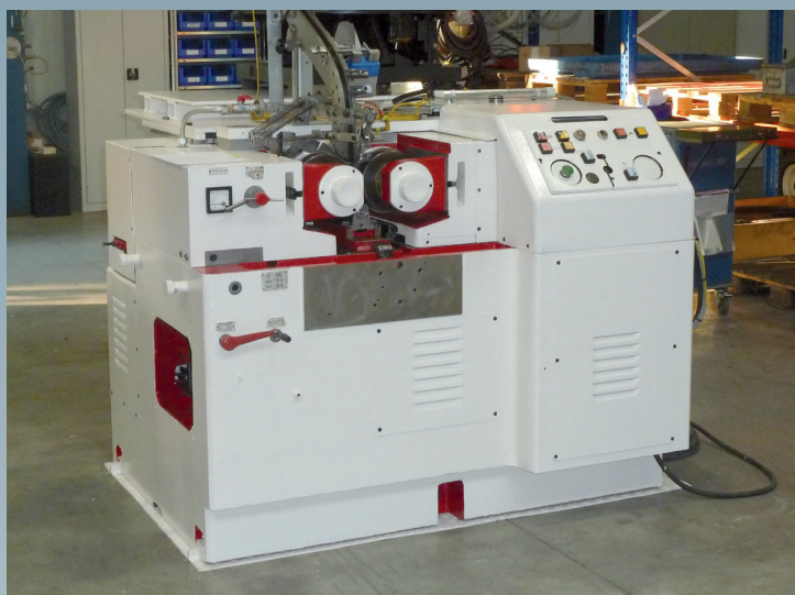
Après la révision générale

Lors de la révision générale la lubrification a été renouvelée ainsi que le câblage électrique du bâti de la machine.